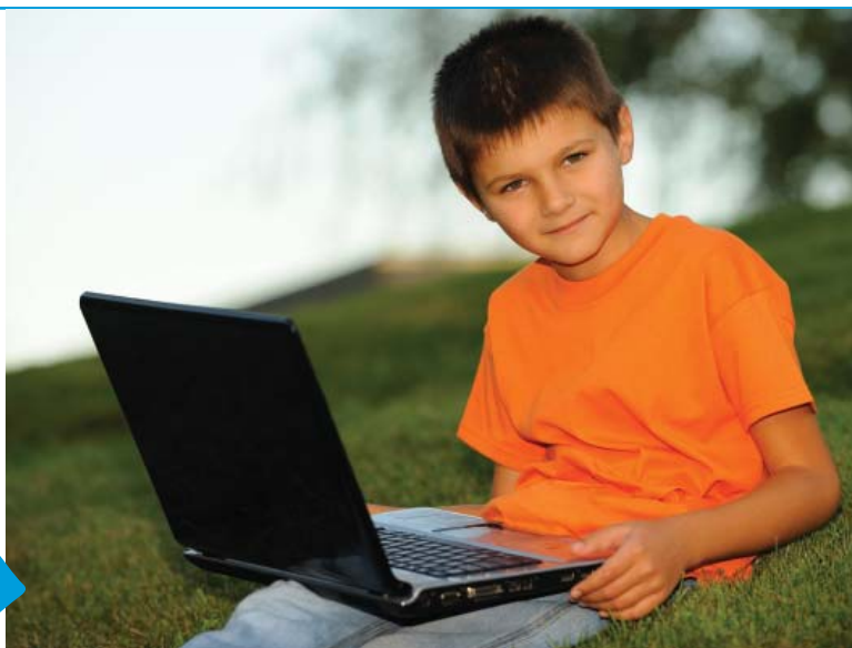
Avui dia no es pot analitzar la realitat de la infància i l'adolescència desvinculant-la de la xarxa

« A la vegada que els experts denuncien les situacions de risc relacionades amb la xarxa, es deixa clar que l'ús d'internet aporta beneficis cabdals per l'aprenentatge i desenvolupament dels infants i joves »