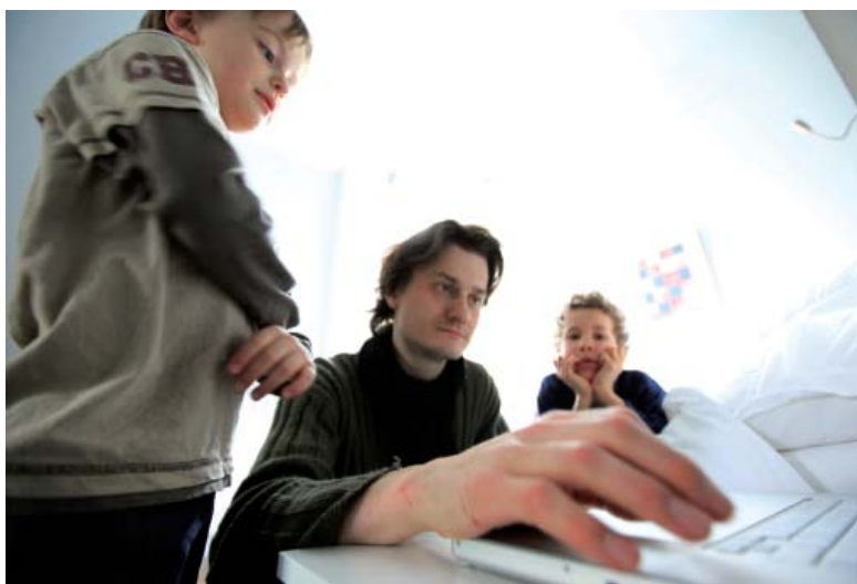
Des dels diferents àmbits educatius cal fer un acompanyament crític respecte a l'ús d'Internet per part dels nois i noies

El bullying , o l'assetjament entre menors, és una realitat social patent en el dia de les escoles, agrupacions de lleure, entre d'altres. Si bé fa unes generacions enrera es veia com normal el fustigar a una persona del grup, i tothom reconeix que ha conegut situacions d'aquest tipus durant la infància i adolescència, no fa tant, històricament parlant, s'ha reconegut com un acte de violència que cal prevenir des dels diferents àmbits educatius.