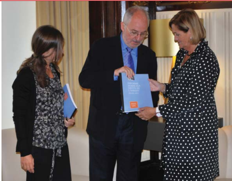
SÍNDIC DE GREUGES

« Els infants són el grup d'edat que més ha vist augmentar la seva precarietat econòmica per l'efecte de la crisi econòmica. Segons dades de l'Institut d'Estadística de Catalunya, la població infantil experimenta un risc de pobresa (23,4%) superior en 6 punts al risc de pobresa de la població adulta »