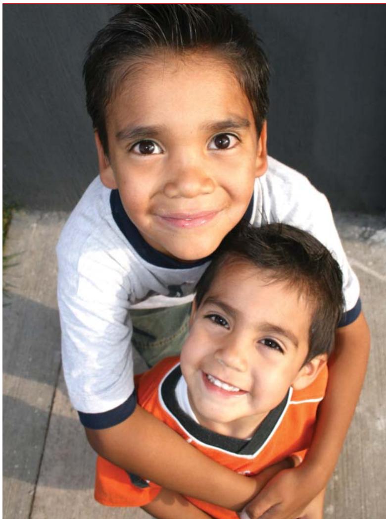
A l'Estat espanyol, el risc de pobresa és més elevat entre els menors de 16 anys

donar carn ni peix als seus fills al menys una vegada al dia. I una quarta part no pot pagar el menjador escolar, fet que dificulta que els nens i nenes puguin gaudir d'una dieta equilibrada.